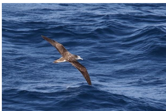
写真⑤ オオミズナギドリ 能代市沖