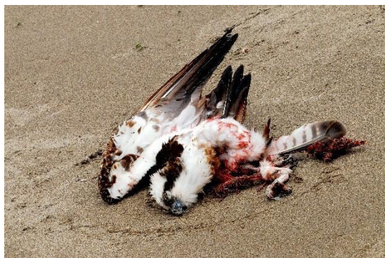
写真⑦ 2018年4月ミサゴ 由利本荘市