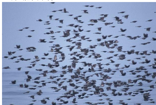
写真⑧ 飛島航路洋上のヒヨドリの群