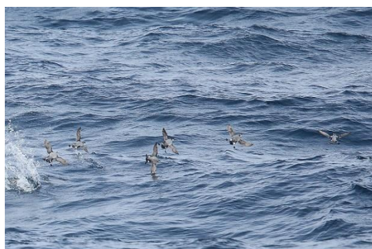
写真⑥ カンムリウミスズメとウミスズメの群 能代市沖