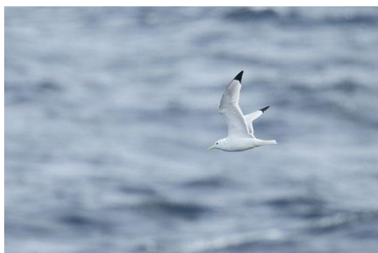
写真③ ミツユビカモメ 男鹿市沖