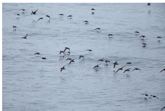
写真④ ハシボソミズナギドリの群 能代市沖