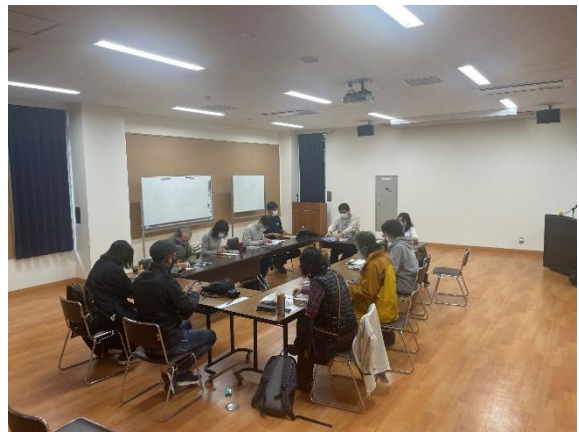
視聴覚室で句作り、俳句の発表をしました

俳句の発表の場面では、普段の句会ではとりあえず数句出せば勝手に評価してもらえるので、1句選ぶというのが逆に難しいという意見がありました。また、短冊に筆ペンで俳句と俳号(ペンネームのようなものです)をしたためてもらいました。私なりのユーモアのつもりでしたが、無駄な豪華さの中には緊張するという方もいました。