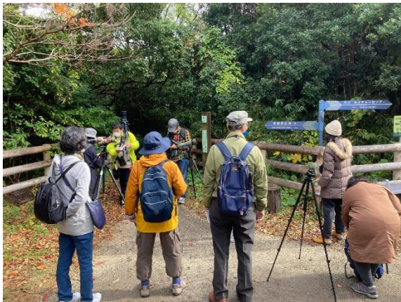
歳時記を片手に野鳥の解説。この時はウグイスの笹鳴きが聞こえてきました。(笹鳴きは冬の季語)

通常、俳句の結社に入っている方が行っている「句会」というものは、各自数句提出し、筆跡で誰が作った俳句か分からないよう提出された俳句を別の紙に書き写した上で、順位付けをします。しかし、俳句探鳥会ではそのような形はとらず、各自一句を発表してもらい、その句に対して担当や参加者の方から感想を寄せてもらうようにしました。